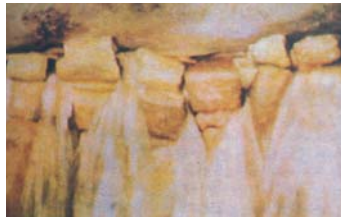
സംസമിന്റെ പഴയകാല ചിത്രം

ഈ ഉറവ കാരണമായി അതിലെ യാത്ര ചെയ്തിരുന്ന കച്ചവടസംഘങ്ങൾ അവിടെ ഇറങ്ങി താമസിക്കുകയും അതെ തുടർന്ന് അവിടെ ജനവാസം ഉണ്ടാവുകയും ചെയ്തു.