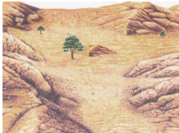
ഇബ്റാഹീം നബി ഹാജറയെയും പുത്രനെയും മക്കയിൽ താമസിപ്പിച്ച സ്ഥലം. കഅ്ബയുടെ ചെറിയ അവശിഷ്ടവും കാണാം. (ഭാവന)

ഹാജറ തന്റെ മകനോടൊപ്പം മരുഭൂമിയുടെ വിജനതയിൽ തനിച്ച് കഴിച്ചുകൂട്ടി. അവരല്ലാത്ത മനുഷ്യരൊന്നും ആ മരുഭൂമിയിൽ ഉണ്ടായിരുന്നില്ല.