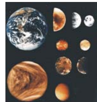
സോളാർസിസ്റ്റത്തിലെ വിവിധ ഗോളങ്ങൾ

ആധുനിക ഉപകരണങ്ങളുടെ സഹായത്തോടെ നോക്കുമ്പോൾ ഈ ആകാശം അനന്തവിസ്തൃതമായ ഒരു പ്രപഞ്ചമായി മാറും; ആദിയും അന്തവും ദർശിക്കാനാകാത്ത, ചിന്തിക്കുംതോറും കണ്ണും മനസ്സും തളർ നുപോകുന്ന, ഗവേഷണങ്ങളിൽ പോലും ഒതുങ്ങാത്ത വിസ്തൃത ലോകങ്ങൾ നിറഞ്ഞ ബ്രഹ്മദ്വീപപഞ്ചം. ഭൂമിയെക്കാൾ ലക്ഷക്കണക്കിന് ഇരട്ടി വലുപ്പമുള്ള അനേകം